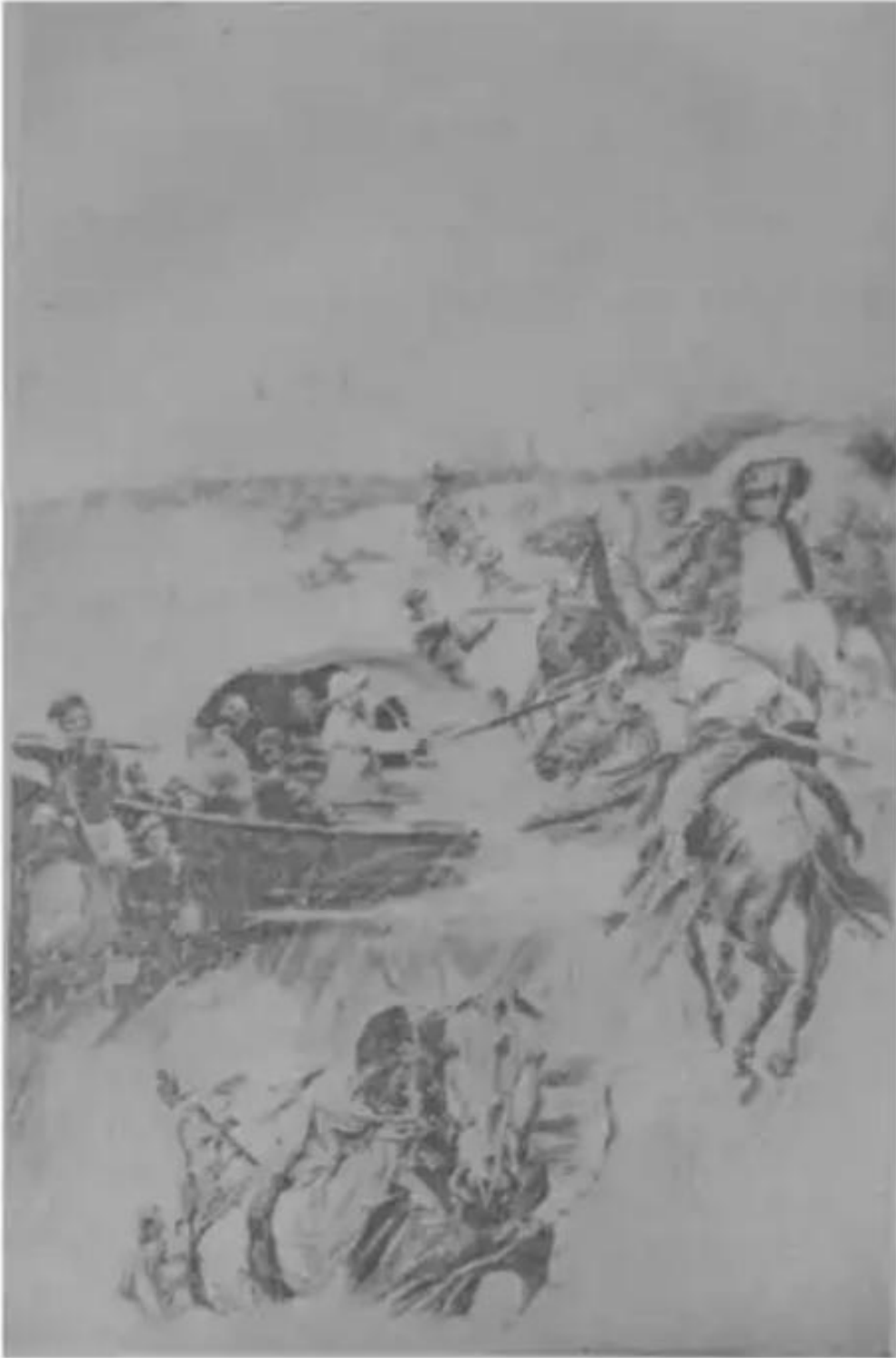
فرسان رابع تفتحهم مواقع الفرنسيين